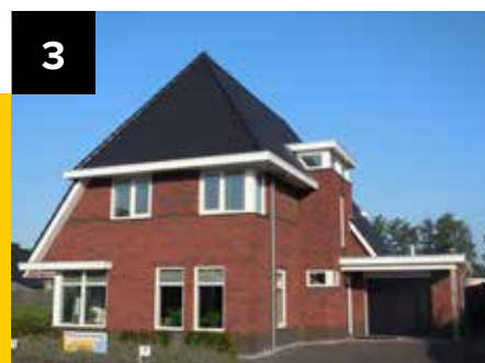
Modelwoning 2: Speenkruid 16 in Drachten